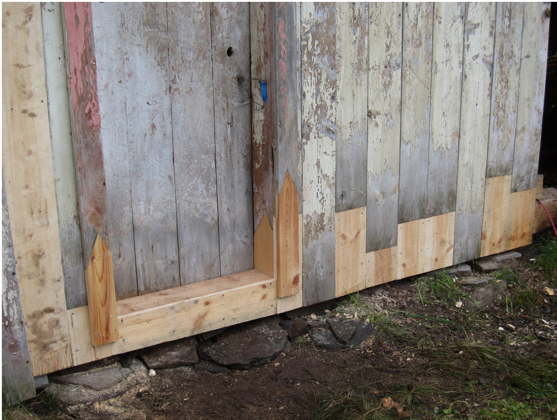
tesařství a truhlářství