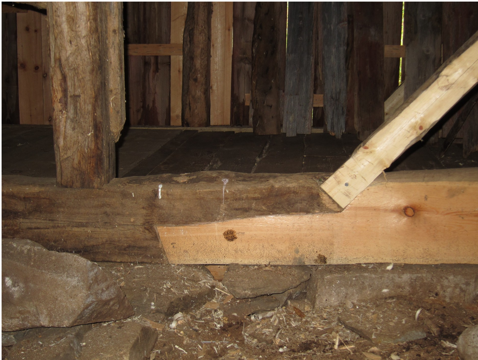
tesařství a truhlářství