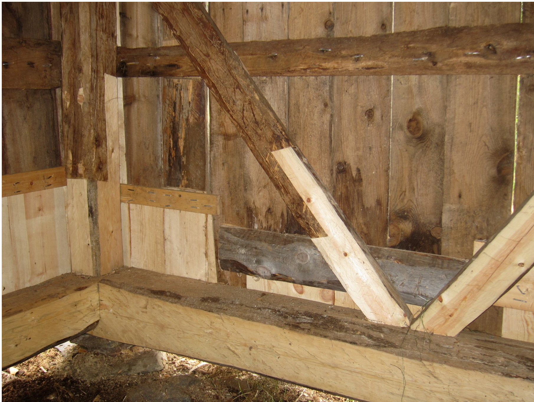
tesařství a truhlářství