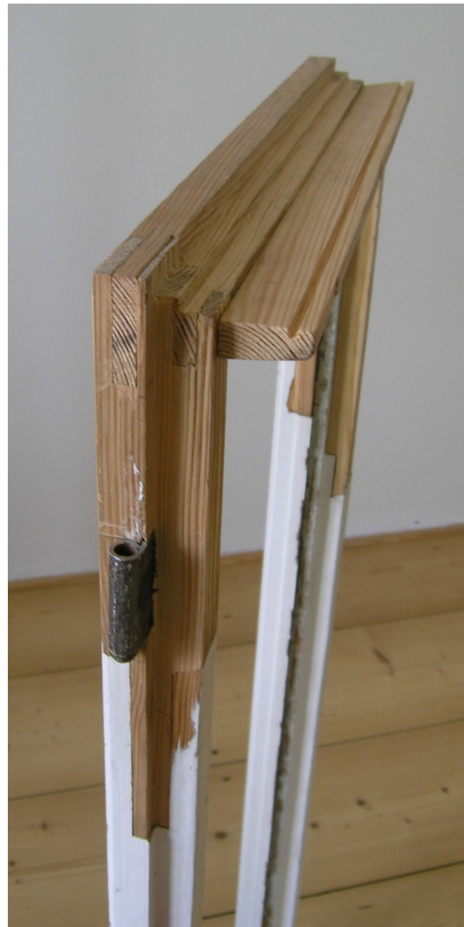
tesařství a truhlářství