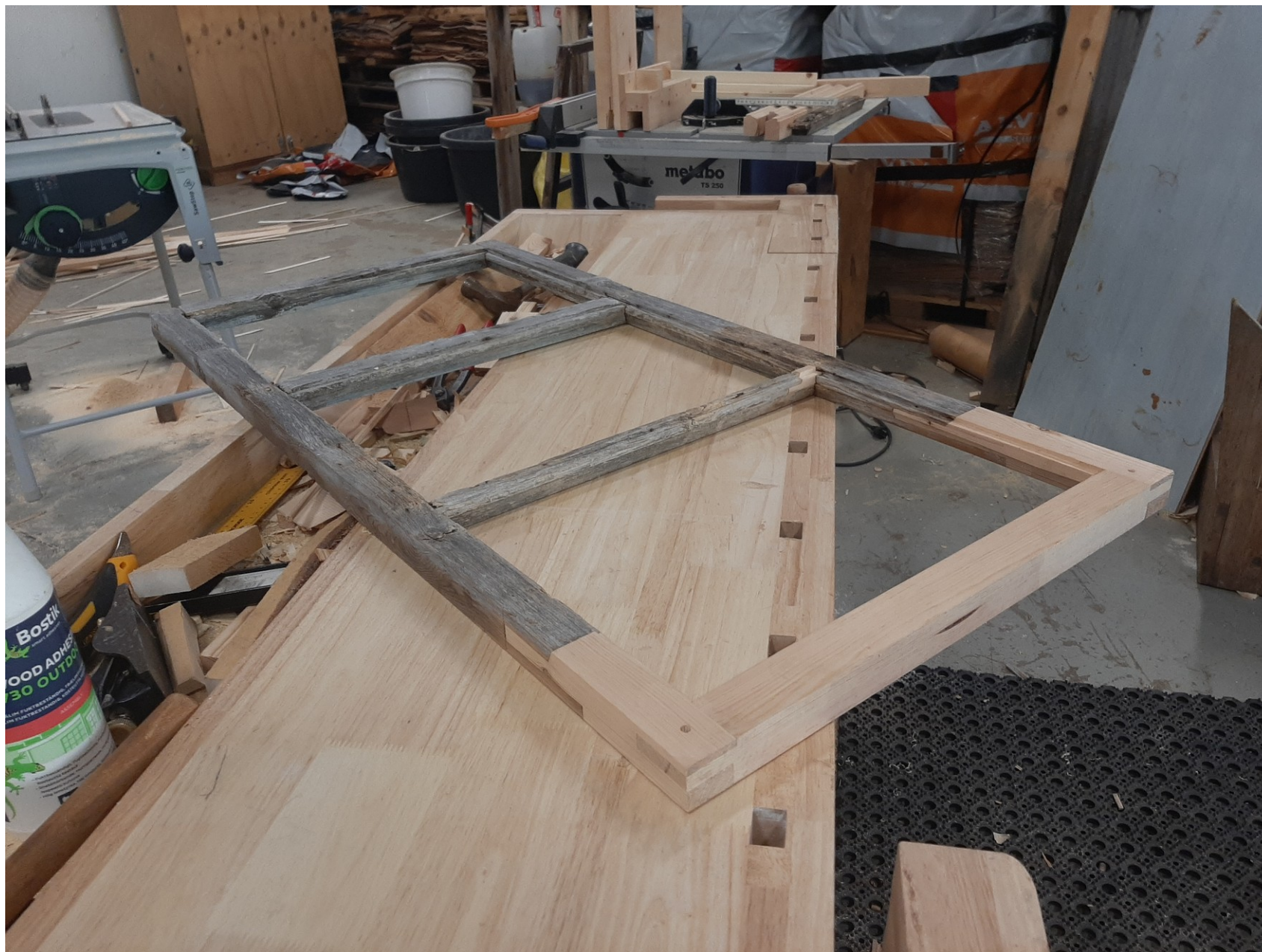
tesařství a truhlářství